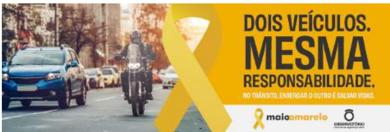
25 x 34 cm