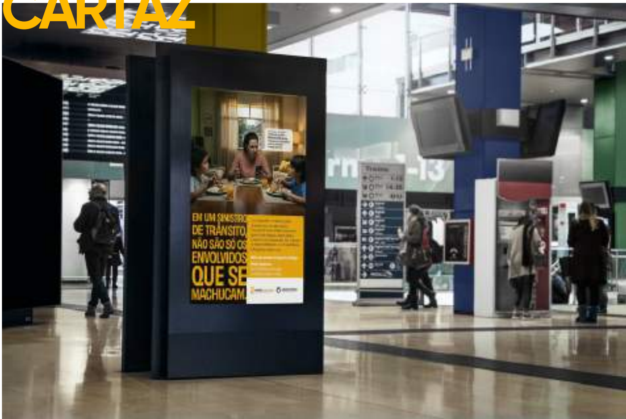
A3 | 29,7 x 42 cm